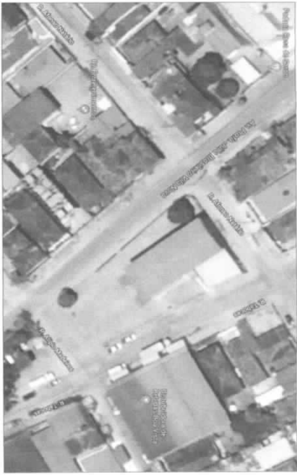
Representação do local via satélite - Google Earth Sem Escala